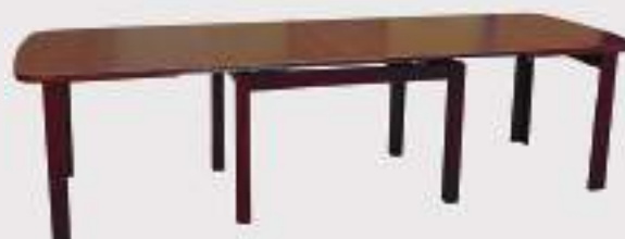
JEDÁLENSKÝ STÔL - ROZLOŽENÝ

140 X 90 - 300 cm, v - 75 cm (4 vklady po 40 cm) 160 X 100 - 360 cm, v - 75 cm (4 - 5 vkladov po 40 cm)