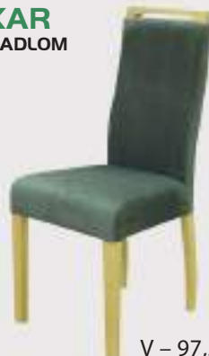
OSKAR S DRŽADLOM