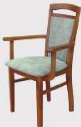
VOJTO S PODRUČKOU