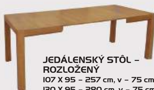
JEDÁLENSKÝ STÔL - ROZLOŽENÝ

107 X 95 - 257 cm, v - 75 cm 130 X 95 - 280 cm, v - 75 cm